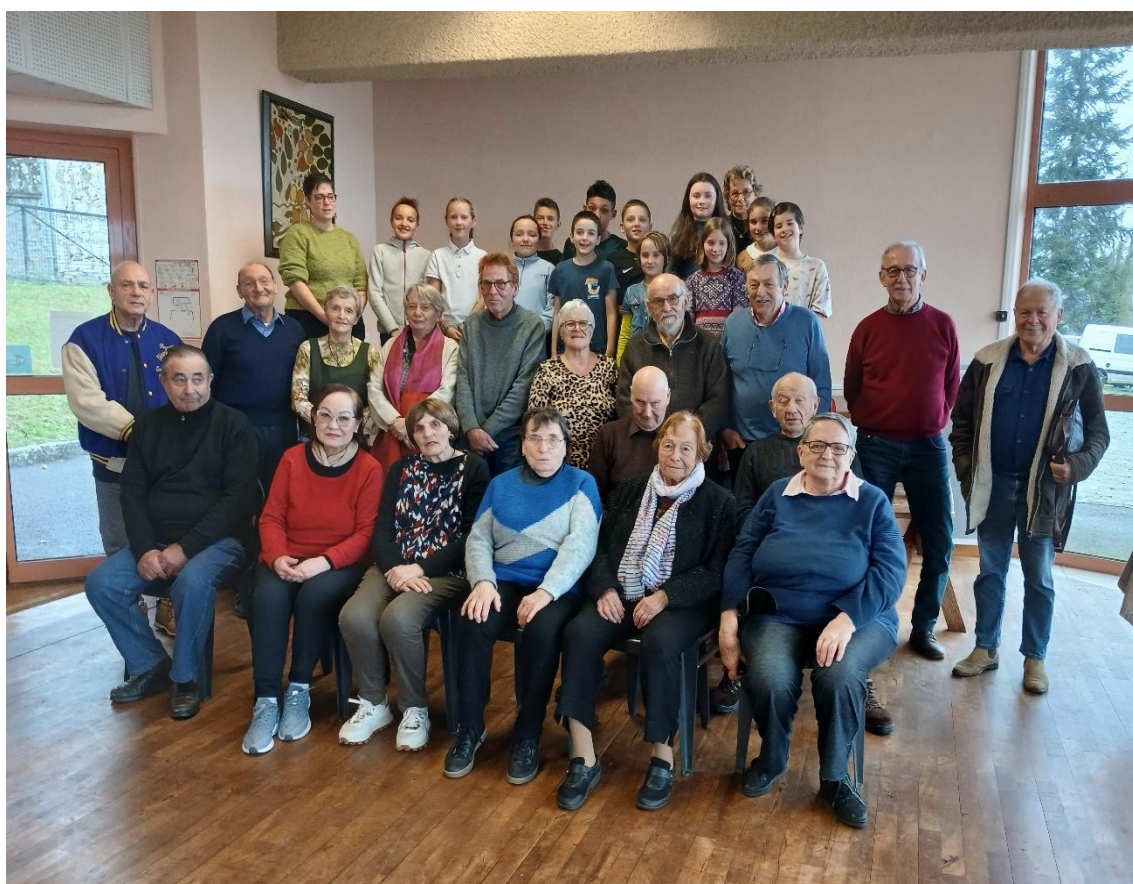
Photo prise lors du goûter de Noël, classe CM1-CM2 de Saint-Silvain et quelques aînés de la commune.

Mairie de Saint-Silvain-Bellegarde 23190 Saint-Silvain-Bellegarde Tél. : 05 55 67 62 47 ; mairie@saintsilvainbellegarde.fr Rédaction et mise en page : Isabelle Carton, Michèle Alouchy, Alain Bujadoux, Alain Grass, Jean-Marie Bertrand