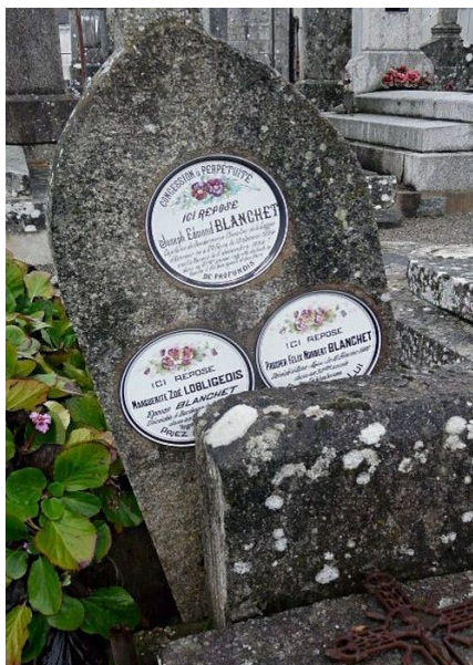
Les Assiettes du cimetière des pénitents noirs de Guéret