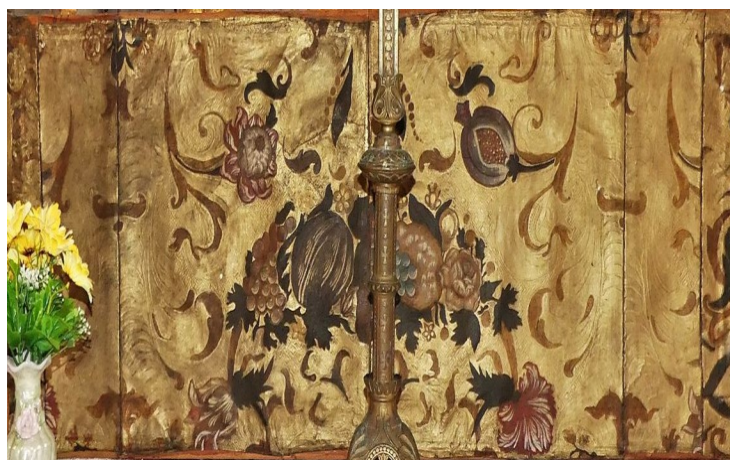
L'Antependium de Saint-Sulpice-Le-Guérois