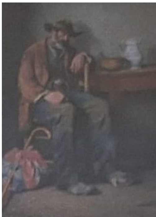
Le Chemineau de Chambon-sur-Voueize